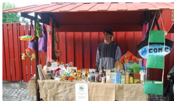
Amosförsäljning vid Medeltidsdagarna

Vill du veta mer om medeltidsdagarnas hela program 10-14 augusti? Titta på deras webbplats http://www.arbogamedeltid.se