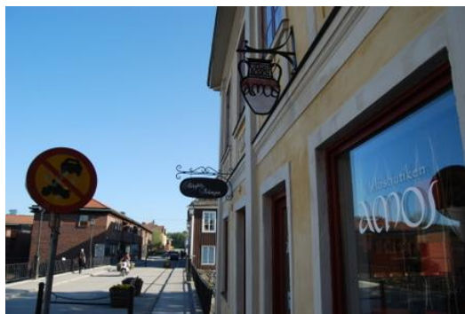
Sommar vid Världsbutiken Amos

Här kommer Amosnytt med aktuell information om sommarens verksamhet.