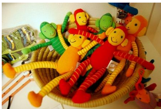
Några exempel på sommarens vara

Längst ner på sidan finns vårt bankgironummer som du använder för att betala medlemsavgiften. Glöm inte att ange namn och adress och gärna e-postadress när du betalar in din medlemsavgift för 2011.